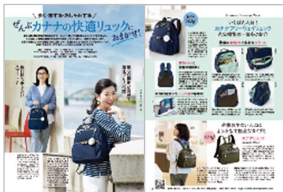
誌面イメージ(前年実績)