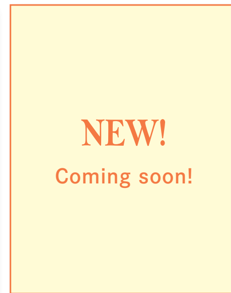
3 『新キャラクター家計簿 2024年10月発売』