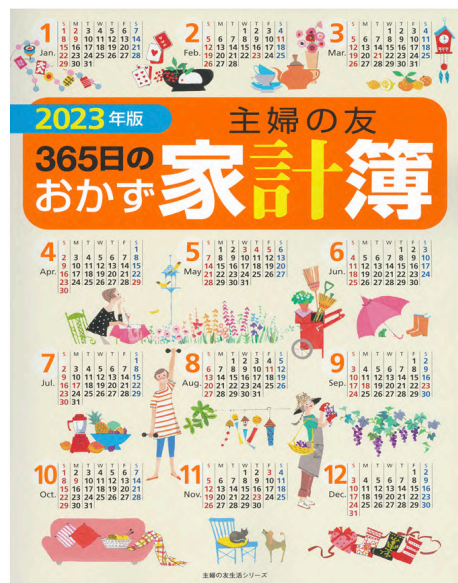
1 『2024年版 主婦の友 365日のおかず家計簿』