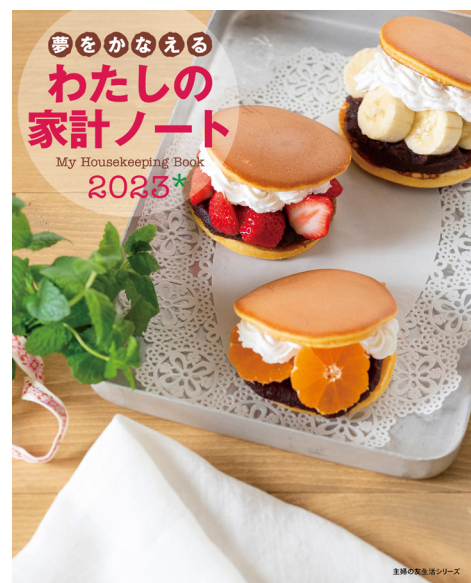
2 『夢をかなえる わたしの家計ノート 2024』